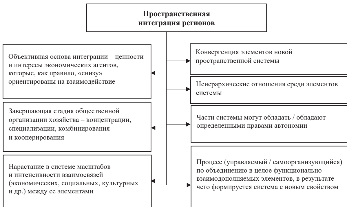
Рис. 1. «Родовые» признаки пространственной интеграции регионов

Неслучайно в рамках политики ЕС и других европейских стран по обеспечению территориального сплочения и интеграции стали широко распространяться различные формы «мягкого» территориального сотрудничества. Основой такого сотрудничества может быть решение общих для них задач в части развития географических и иных объектов («структурирующие» объекты